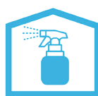
消毒用アルコールの設置 室内の除菌を徹底